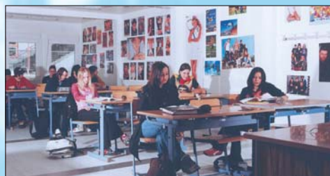
Escuela con módulos CTX