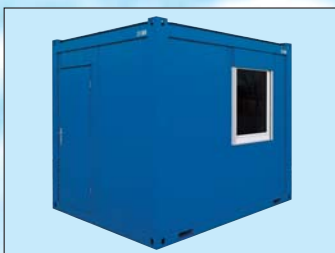
Modelo BM 10'

Un sistema flexible de construcción modular con diferentes variantes en el equipamiento permiten soluciones de espacio diseñadas individualmente.