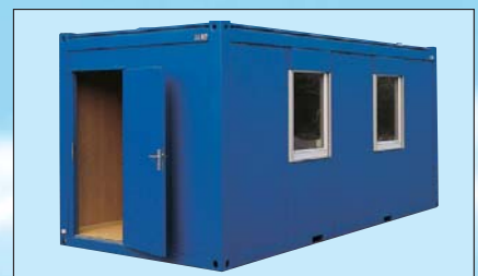
Modelo BM 20'

Los módulos de oficina Containex pueden ser utilizados tanto individualmente como para estructuras modulares. Eliminando paneles y paredes intermedias se pueden construir grandes espacios según se desee.